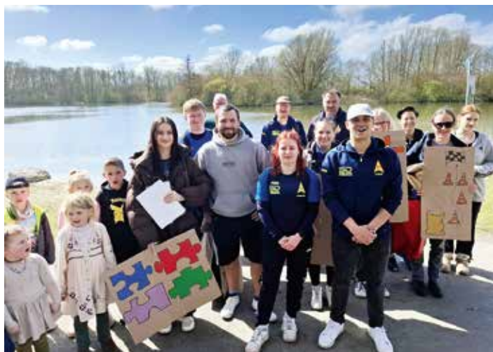
Tolle Stimmung bei den Teilnehmern der Osterschnitzeljagd.

Die Premiere der Osterschnitzeljagd des SV Nordenham im Seenpark war ein voller Erfolg. Bei bestem Frühlingswetter nahmen über 100 Kinder im Alter bis zehn Jahren an der Veranstaltung teil und verwandelten das Gelände rund um den See in eine lebendige Erlebniswelt voller Spiel, Bewegung und Entdeckungen.