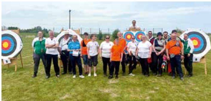
Die Teilnehmer der diesjährigen KM im Freien.

Am 3. Mai 2026 versammelten sich die Bogensportler der Wesermarsch trotz leichtem Nieselregen auf dem Sportplatz in Kleinensiel zur diesjährigen Kreismeisterschaft Bogen im Freien nach den Regeln der World Archery (WA) ein. Die gute Stimmung der Sportler färbte anscheinend auch auf das Wetter ab, denn die für den frühen Nachmittag angekündigten Gewitter verschoben sich immer weiter in die Abendstunden. Beim Aufbau der Scheiben halfen die Bogenschützen aller Vereine eifrig mit, so dass vor Wettkampfbeginn noch Zeit blieb, um das Catering des Gastgebervereins SV Kleinensiel zu genießen.