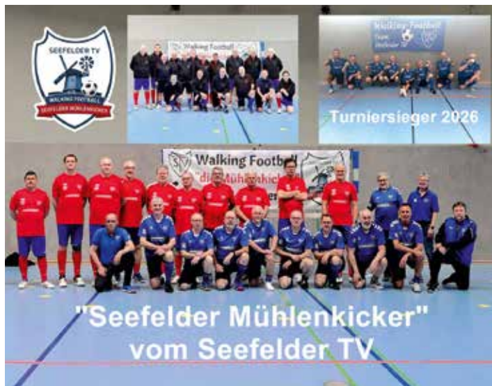
Teilnehmer des Turniers.