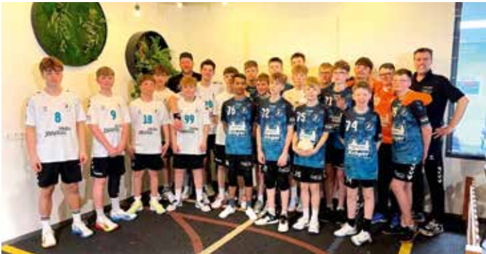
HSG Unterweser m C beim Turnier in Arnheim Niederlande

Mit zwei Mannschaften nahm die HSG Unterweser am Turnier der männlichen Jugend C in Arnheim (Niederlande) teil. Über die Osterfeiertage – von Karfreitag bis Ostermontag – traten die Mannschaften im Leistungszentrum des Niederländischen Handballverbandes in Valkenhuizen, einem Ortsteil von Arnheim, gegen internationale Konkurrenz an. Für die erste C-Jugend der HSG ging es vor allem darum, sich auch auf internationalem Parkett zu beweisen und gleichzeitig die Form für die bevorstehenden Landesliga-Spiele zu halten. Gegner waren Teams aus Dänemark, Schweden und Deutschland. In der Vorrunde traf die HSG I zunächst auf Skorping Handbold I aus Dänemark in der Nähe von Aalborg. Die Dänen erwiesen sich als gleichwertiger Gegner und gewannen knapp mit 10:9. In den weiteren Vorrundenspielen zeigte sich die HSG I dann überlegen: Gegen MTV Geismar (Oberliga) gewann das Team mit 20:15, gegen die HSG Odenwald (Bezirksoberliga) sogar mit 20:9. Damit war das Viertelfinale erreicht. Dort traf die HSG I auf Skorping Hand-