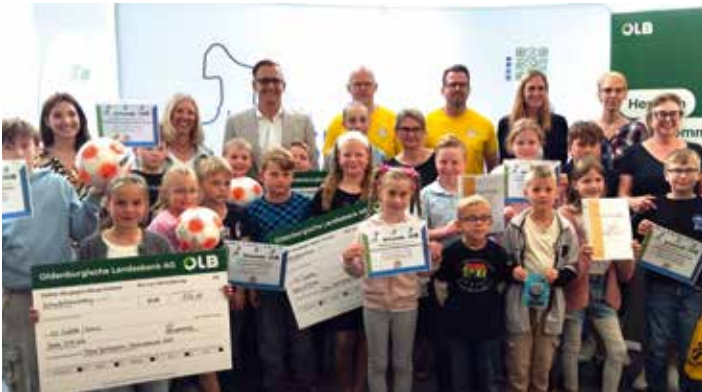
Mit Bällen, Urkunden und Schecks wurden auch die jüngsten Sportabzeichen-Absolventen ausgezeichnet.