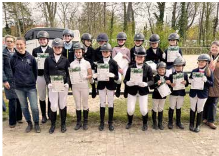
Die Teilnehmerinnen für das Reitabzeichen.