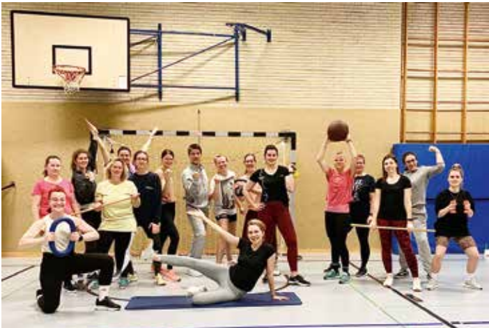
Die Teilnehmer*innen der PowerGym-Sportgruppe.

Die PowerGym-Sportgruppe vom Elsflether Turnerbund ist im Januar wieder motiviert ins neue Jahr gestartet. Jeden Dienstag treffen sich die Teilnehmerinnen und Teilnehmer von 18 bis 19 Uhr in der Turnhalle an der Wurfstraße, um sich gemeinsam auszupeinern und fit zu halten. Rund 45 Minuten lang stehen abwechslungsreiche Übungen zu mitreißender Musik und motivierenden Beats auf dem Programm.