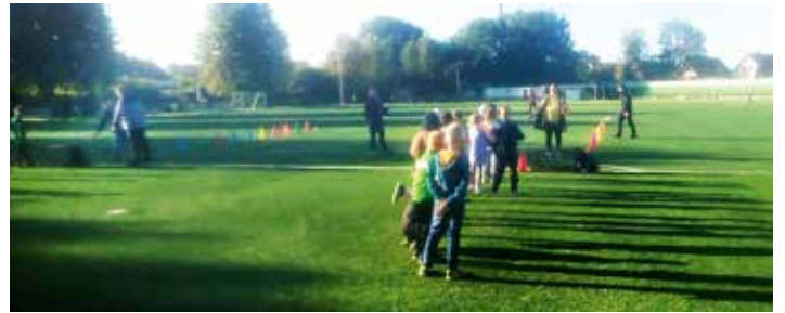
Das Foto zeigt eine Klasse beim Zonendrehwurf. Bild: Verein

Elsflether Turnerbund von 1862 1. Vorsitzender: Hermann Buse Grüne Straße 4 26931 Elsfleth Tel. (04404) 25 93 info@elsflether-tb.de www.elsflether-tb.de