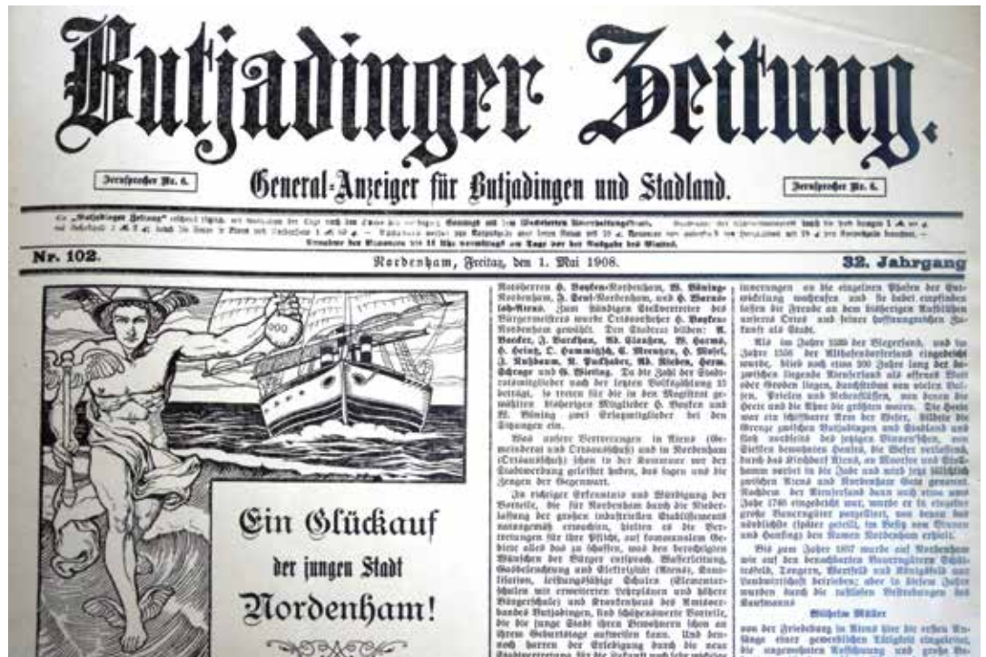
Zur Verleihung der Stadtrechte an die junge Stadt Nordenham gratulierte die Butjadinger Zeitung, Vorgänger der Kreiszeitung Wesermarsch, der Stadt Nordenham in der Ausgabe vom 1. Mai 1908.