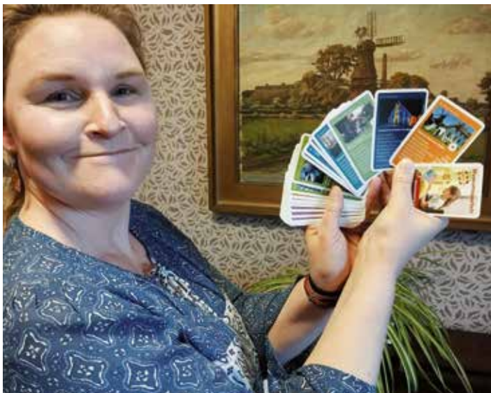
Die Moorseeer Mühle ist Teil eines neuen Museumsquartetts des Museumsverbandes Niedersachsen und Bremen.