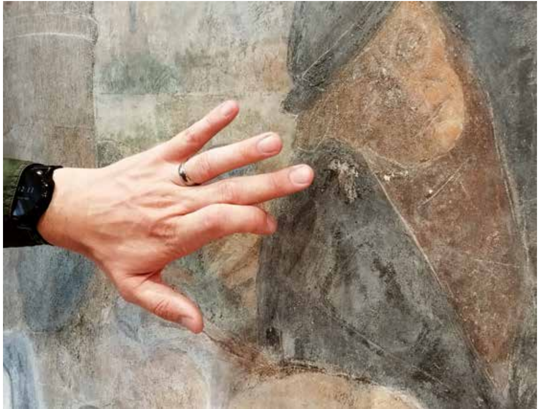
Eine der schadhafte Stellen auf dem Bruderkuss-Bild.

der Wert eines Kunstwerks liegt oftmals nicht im Preis seiner Anschaffung, sondern in seiner Bedeutung für den Besitzer. So ist es auch mit dem Rüstringer Heimatbund und einem seiner wichtigsten Sammlungsobjekte. 2004 wurde „Der Bruderkuss“ im Haus der Familie Lübben in Schmalenfletherwurf von der Wand genommen, da das 1893 von Hugo Zieger gemalte Fresko vor Ort von Zerstörung bedroht war. Im Zuge der Rettungsmaßnahme gelangte das Bild in den Besitz des Rüstringer Heimatbund, der eine erste Restaurierung und Sicherung des vor allem durch Feuchtigkeit geschädigten Werkes durchführen ließ.