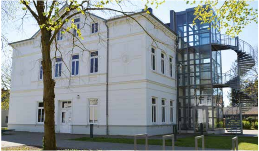
Wie alle Häuser im Museumsverband Wesermarsch ist auch das Museum Nordenham in einem historischen Gebäude untergebracht. Die ehemalige Südschule ist ein neoklassizistischer Bau aus der Wilhelminischen Zeit.