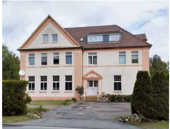
Äußerlich kaum verändert wird die ehemalige katholische Schule heute für Wohnzwecke genutzt.

Die Wahlwiederholung fand statt am 3. Dezember 1950. Am 6. Dezember teilt die Schule der Schulrätin mit, dass nur 14 Elternteile erschienen waren. Bürgermeister Müller nahm teil, Donath ließ sich entschuldigen. Die anwesenden Eltern lehnen eine Wahl-