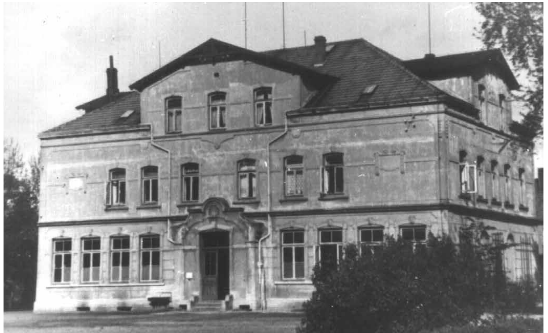
Dieses Bild der katholischen Schule an der Einswarder Werftstraße entstand vermutlich 1944.

Mit dem Schulbau auf einem von Bauer Wilhelm Plump er-