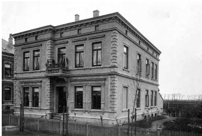
Seit 1892 hat die Kreiszeitung Wesermarsch ihren Sitz im Verlagsgebäude an der Bahnhofstraße.