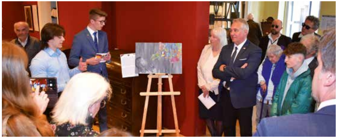
Bei der Feier im Museum wurden drei von Schülern des Gymnasiums Nordenham geschaffene Bilder zum Thema Frieden und Gemeinschaft enthüllt.