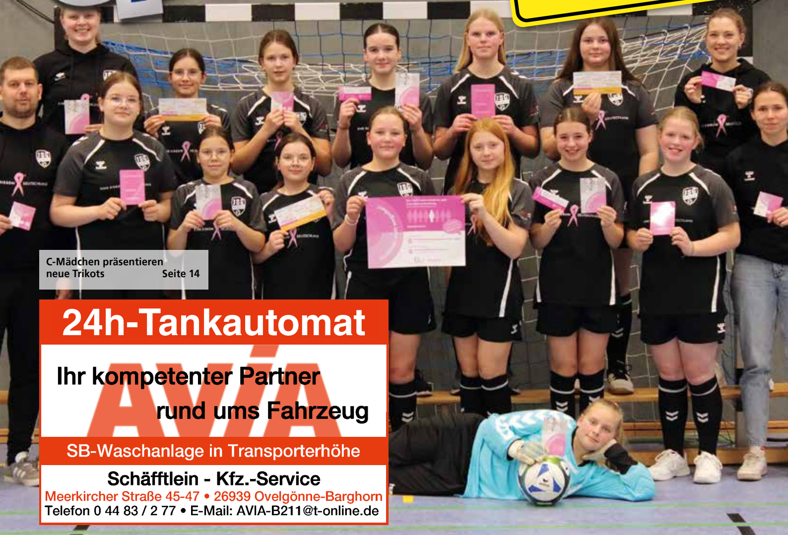
C-Mädchen präsentieren neue Trikots Seite 14