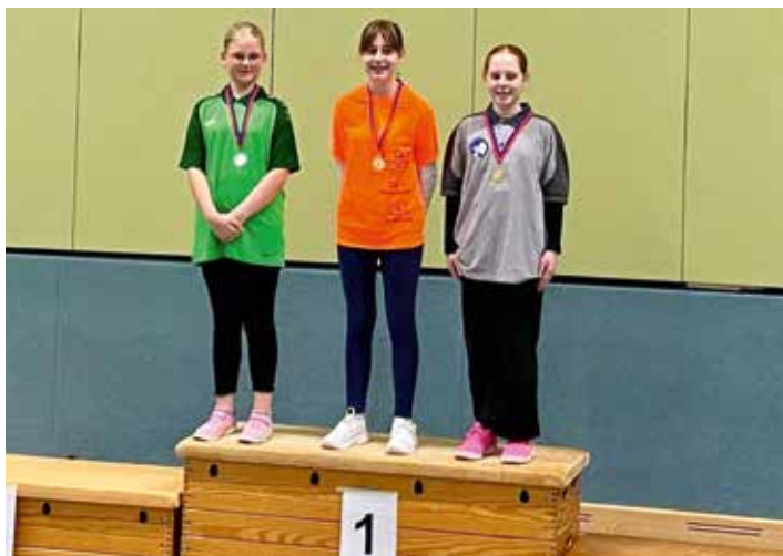
Siegerehrung Recurve Schülerinnen A