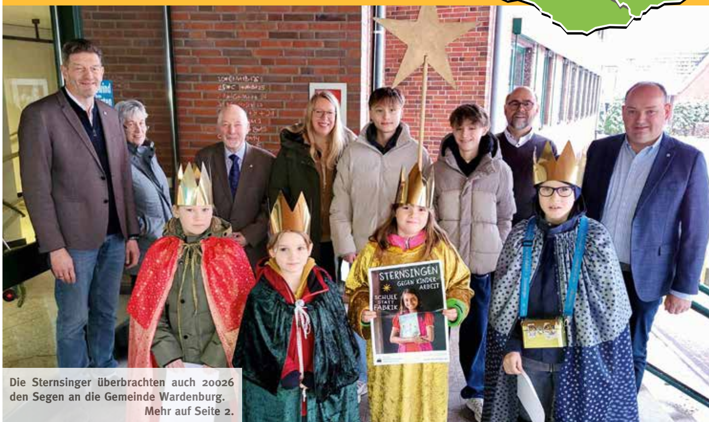
Die Sternsinger überbrachten auch 2026 den Segen an die Gemeinde Wardenburg. Mehr auf Seite 2.