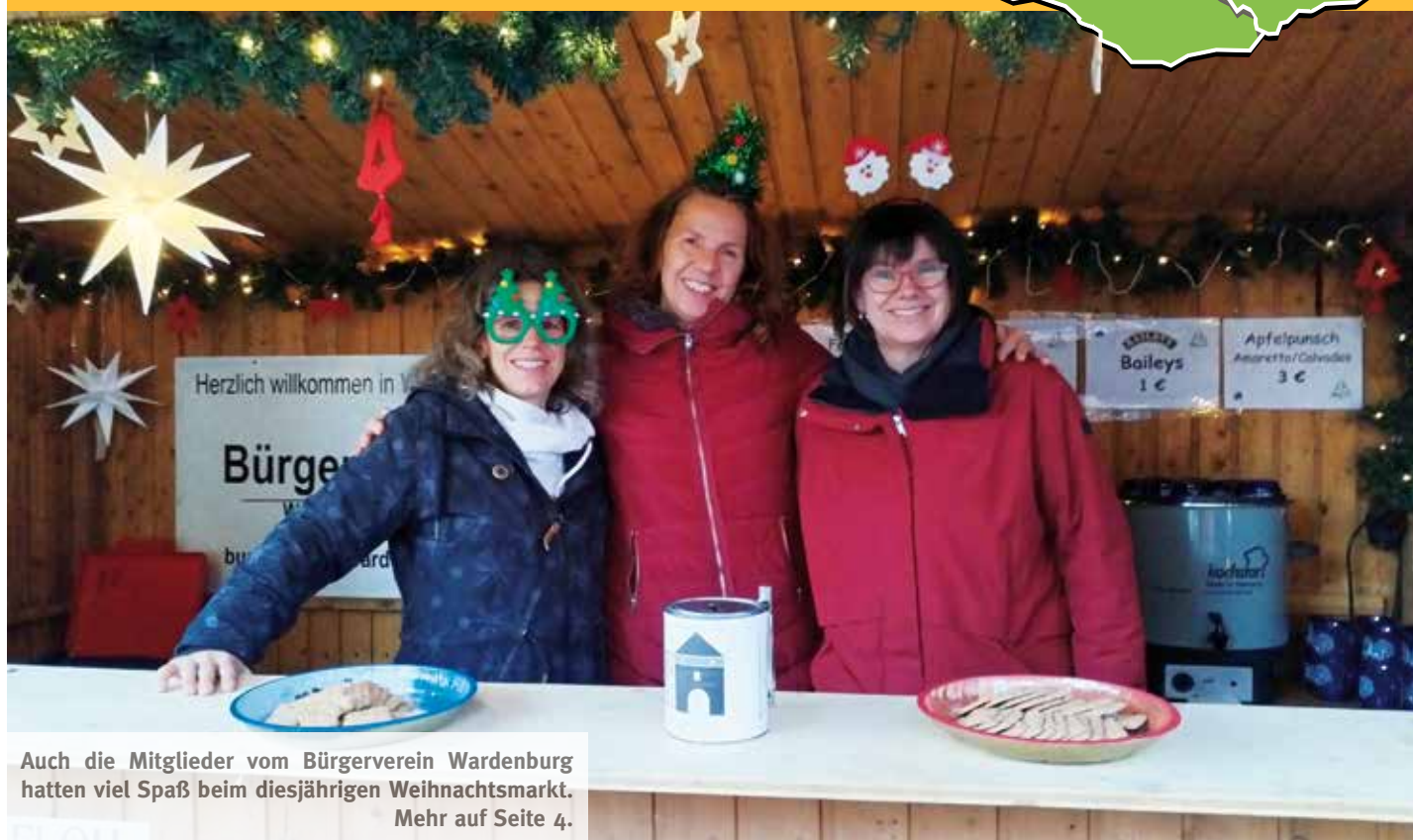
Auch die Mitglieder vom Bürgerverein Wardenburg hatten viel Spaß beim diesjährigen Weihnachtsmarkt. Mehr auf Seite 4.

Regionale Nachrichten // unabhängig/überparteilich