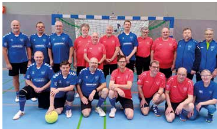
Team „rot und blau“ des Seefelder TV