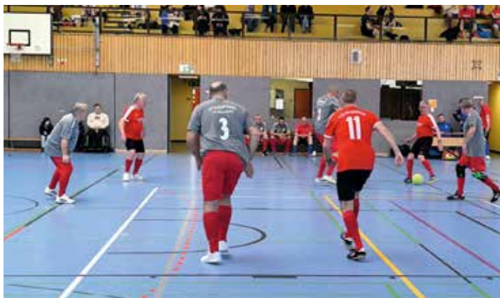
TV Neuenburg – TuS Hasbergen