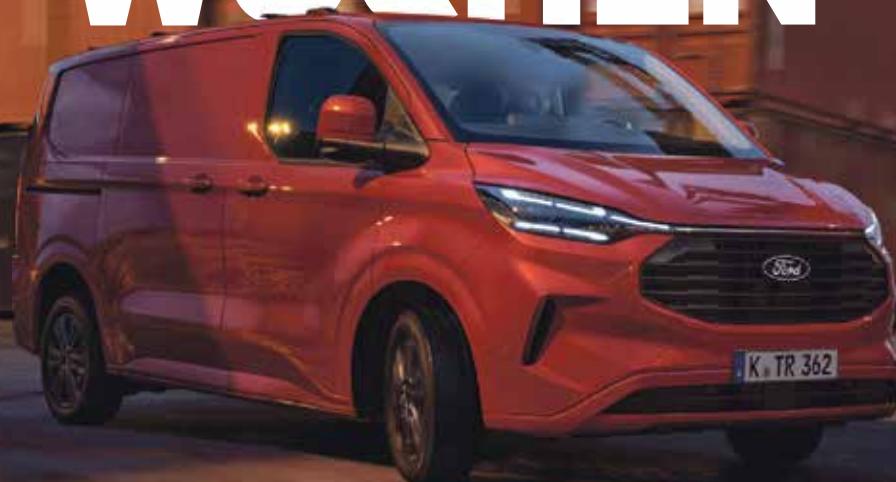
Ford Transit Custom 320 TDCi