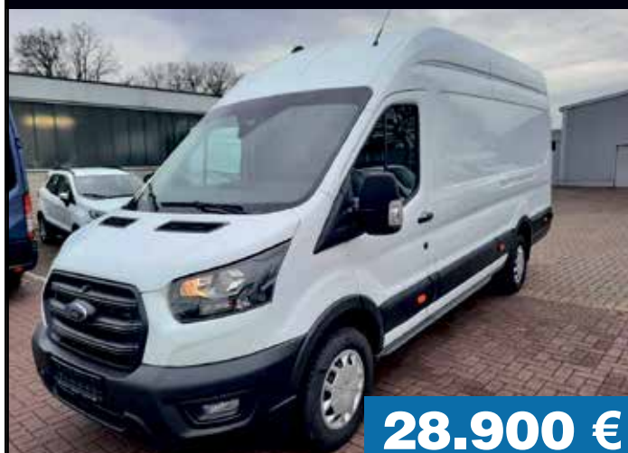
Ford Transit 350 TDCi L4H3 Lkw

EZ: 04.2023, Kilometer: 27.606, KW/PS: 96 (131 PS), Hubraum: 1.996 ccm, Kraftstoff: Diesel, Farbe: Blau, Gänge: Schaltgetriebe, Türen: 4, Paket: Sicht-Paket III, Räder: Ganzjahresreifen (wintertauglich), Park-Pilot-System, v.u.h., Rückf.-Kam., NS, Sitze: Sitz-Paket 15, Radio: Audiosystem 24, Außenspiegel el.-einst.-beheiz.- u. klappbar, Außenspiegel mit Toter-Winkel-Assistent, Handschuhfach mit Deckel, Airbag Fahrer- und Beifahrerseite, ABS elektronisch mit EBD, Elektronisches Sicherheits- u. Stabilitäts-, Bordcomputer, Wärmeschutzverglasung, leicht getönt, Drehzahlmesser, Fensterheber elektrisch vorn, Park-Pilot-Systeme v.u.h. inkl. Nebelsch., Scheinwerfer-Abblendlicht/Tagfahrlicht, Klimaanlage vorn, Sitze: 3 Sitze 2. und 3. Reihe, Sitze: Sitz-Paket 13 Custom Trend, Notbremsunterstützung inkl. Notbremslicht, Radio: Audiosystem 13