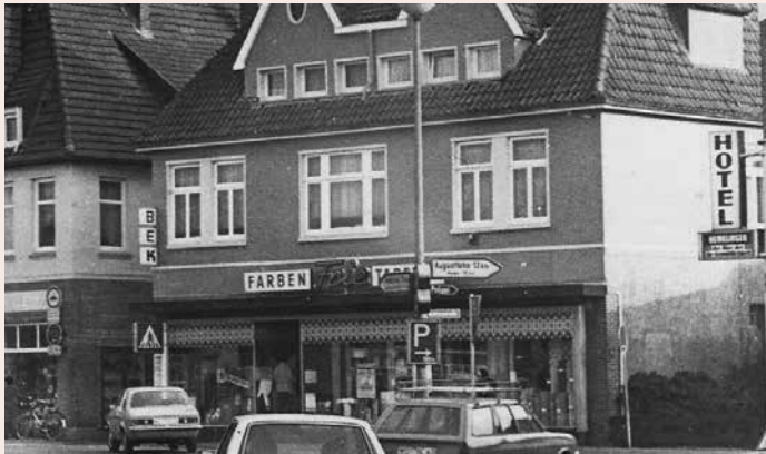
Eine Aufnahme zur Zeit von „Farben Frie“ um 1980 zeigt das Gebäude von der Straßenseite aus.

PS – Häuser erzählen ihre ganz eigenen Geschichten und haben Generationen oder gar Jahrhunderte überlebt. Somit spiegeln die alten Gebäude auch immer ein Stück Heimatgeschichte wieder. In dieser Rubrik werden geschichtsträchtige Häuser mit Vergangenheit vorgestellt, die nur noch zum Teil oder schon lange nur noch in unserer Erinnerung stehen.