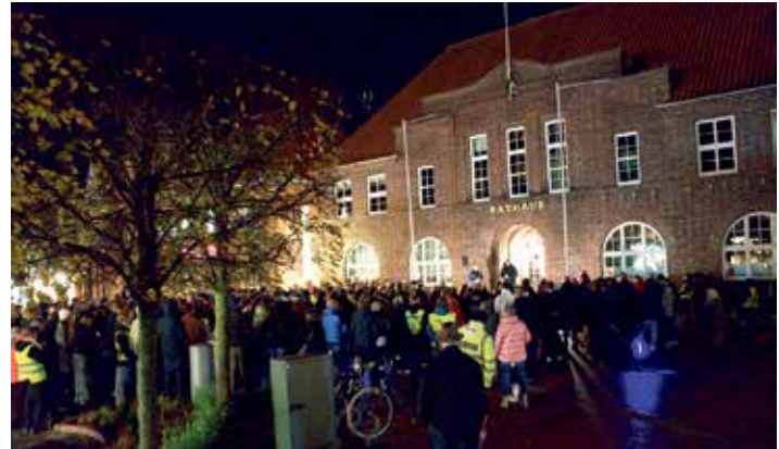
Start des Gedenkgangs im letzten Jahr