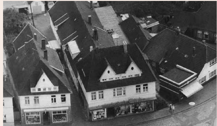
Platz für mehrere Wohnungen und Geschäfte. Die Vogelperspektive zeigt die ganze Größe des Hauses um 1965.

Der Wiederanfang war für Heinrich Houtrouw ein holpriger, der alles versuchte um als Geschäftsmann auf die Beine zu kommen. Als kurz nach dem Krieg von den britischen Besatzern Fahrzeuge aus Wehrmachtsbeständen konfisziert und im Wittenheimer Busch abgestellt wurden, könnte der Gedanke gereift sein, sich als Spediteur zu betätigen. So wurden brauchbare Lastkraftwagen kurzerhand vor Ort gangbar gemacht und unbemerkt durch das „Hintertürchen“ aus dem nur schwach bewachten Wald gefahren werden. In der Lange Straße wurden sie dann für zivile Bedürfnisse „umgestaltet“.