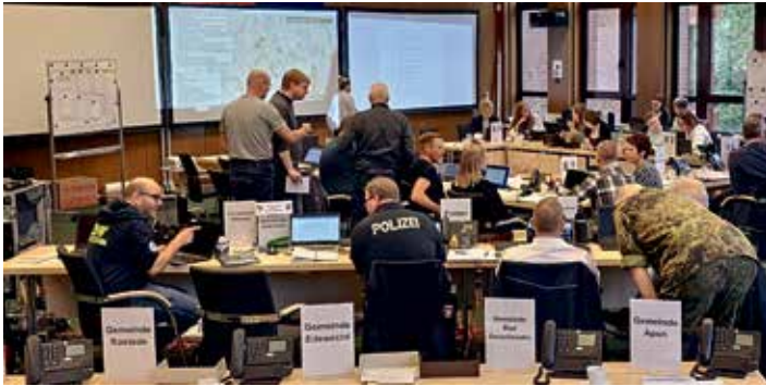
Katastrophenschutzstab übt den Ernstfall im Kreishaus in Westerstede.

wk - Das Umweltbildungszentrum hat im September einen regionalen Schulgarten-Praxistag im Park der Gärten in Bad Zwischenahn-Rostrup für interessierte Lehrkräfte der Schulen in der Weser-Ems-Region angeboten. Rund 40 Lehrerinnen und Lehrer sowie in Schulgärten aktive Personen nahmen an der ganztägigen Veranstaltung teil, die vom Arbeitskreis Schulgärten der Oldenburger Schulen, dem Schulgartennetzwerk Region Osnabrück sowie dem Arbeitskreis Schulgärten im Ammerland organisiert wurde. Die Schulgartentage finden in Niedersachsen regelmäßig statt und dienen zum aktuellen Austausch und Kennenlernen neuer Methoden und Praktiken für die Schulgartenarbeit.