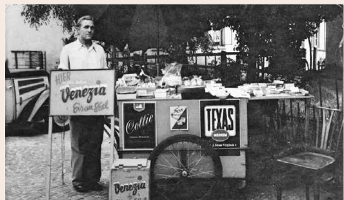
„Aller Anfang ist schwer...“ Das „Venezia“: Eis am Stil à la Houtrouw. Undatiert, vermutlich Ende 1940er Jahre.

Lesen sie in der nächsten Ausgabe wie ein „Keks“ dem „Holland-Import“ zum Erfolg verhilft.