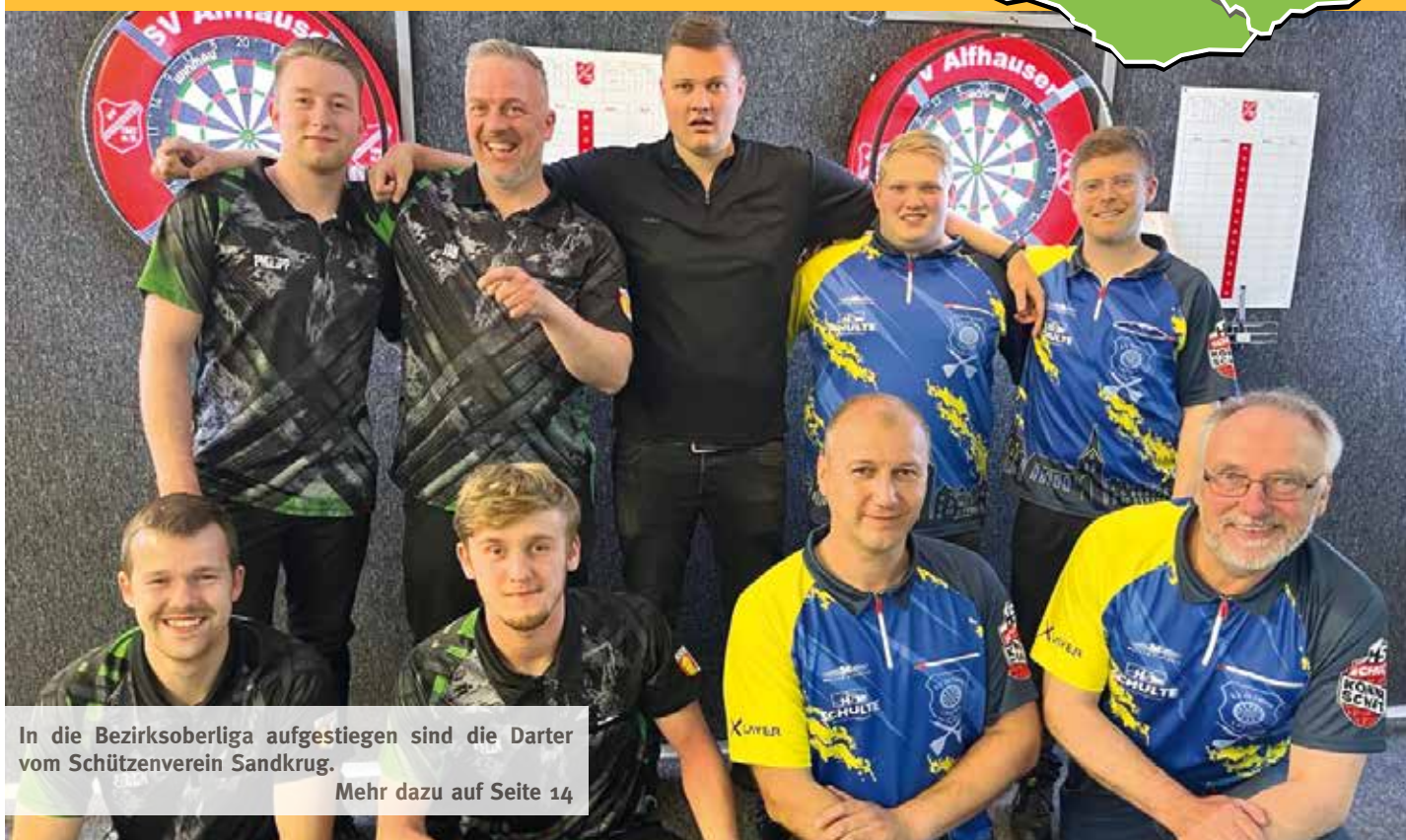
In die Bezirksoberliga aufgestiegen sind die Darter vom Schützenverein Sandkrug.

Regionale Nachrichten // unabhängig/überparteilich