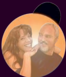
KARO AKUSTIK DUO

EINTRITT AB 21 UHR MIT PARTYTICKET FÜR 15€ MÖGLICH