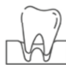
Zahnersatz / Prothetik