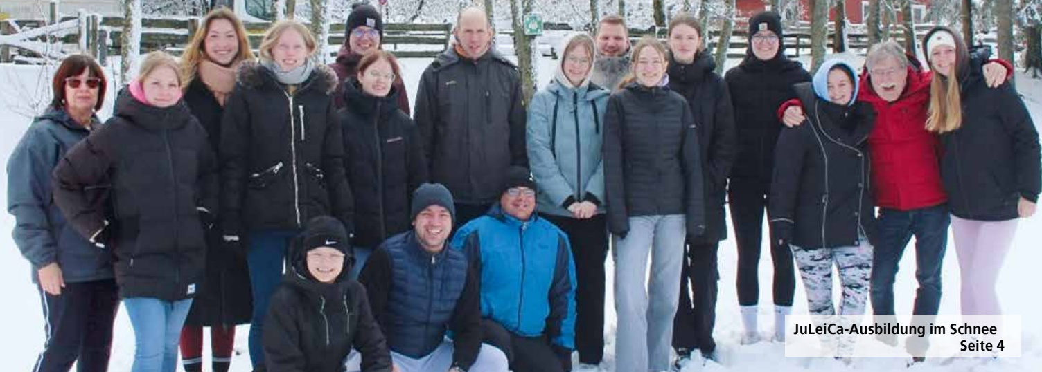
JuleiCa-Ausbildung im Schnee Seite 4