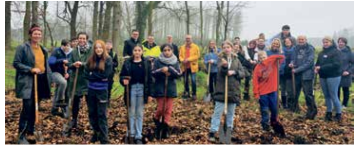
Im Rahmen einer Initiative des Landkreises und von EWE haben rund 30 Schülerinnen und Schüler der Oberschule Westerstede 2000 Baumsetzlinge in den Waldboden bei Linswege gebracht.