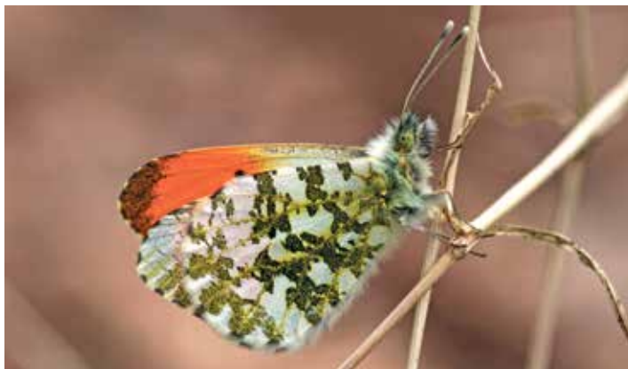
Der Aurorafalter, hier ein männliches Exemplar, ist ein typischer Frühlingschmetterling und fliegt schon im April.