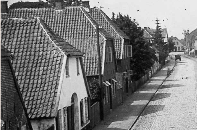
Diese Aufnahme zeigt in der Mitte noch die beiden baugleichen Häuser um 1900.

PS – Häuser erzählen ihre ganz eigenen Geschichten und haben Generationen oder gar Jahrhunderte überlebt. Somit spiegeln die alten Gebäude auch immer ein Stück Heimatgeschichte wieder. In dieser Rubrik werden geschichtsträchtige Häuser mit Vergangenheit vorgestellt, die nur noch zum Teil oder schon lange nur noch in unserer Erinnerung stehen.