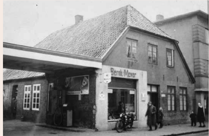
Dieses undatierte Bild entstand vor 1950 und zeigt unter dem Überdach bereits eine Zapfsäule.