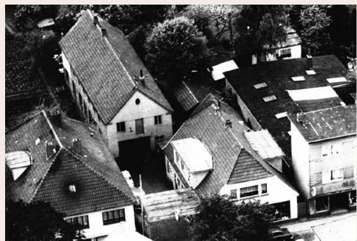
1957: Im Haus vorne war die „Fahrradabteilung“ - hinten die Mercedes-Werkstatt.