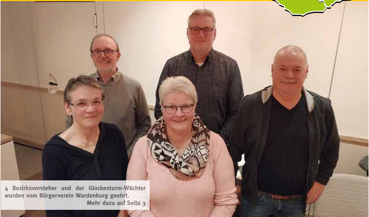
4 Bezirksvorsteher und der Glockenturm-Wächter wurden vom Bürgerverein Wardenburg geehrt. Mehr dazu auf Seite 3

Regionale Nachrichten // unabhängig/überparteilich