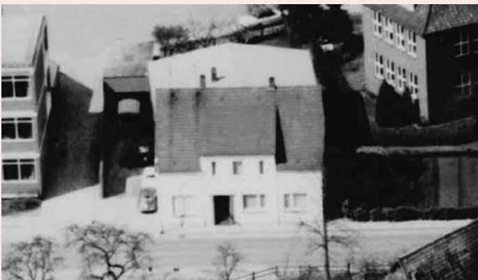
Die Luftaufnahme zeigt bereits 1973 die knappen Platzverhältnisse.