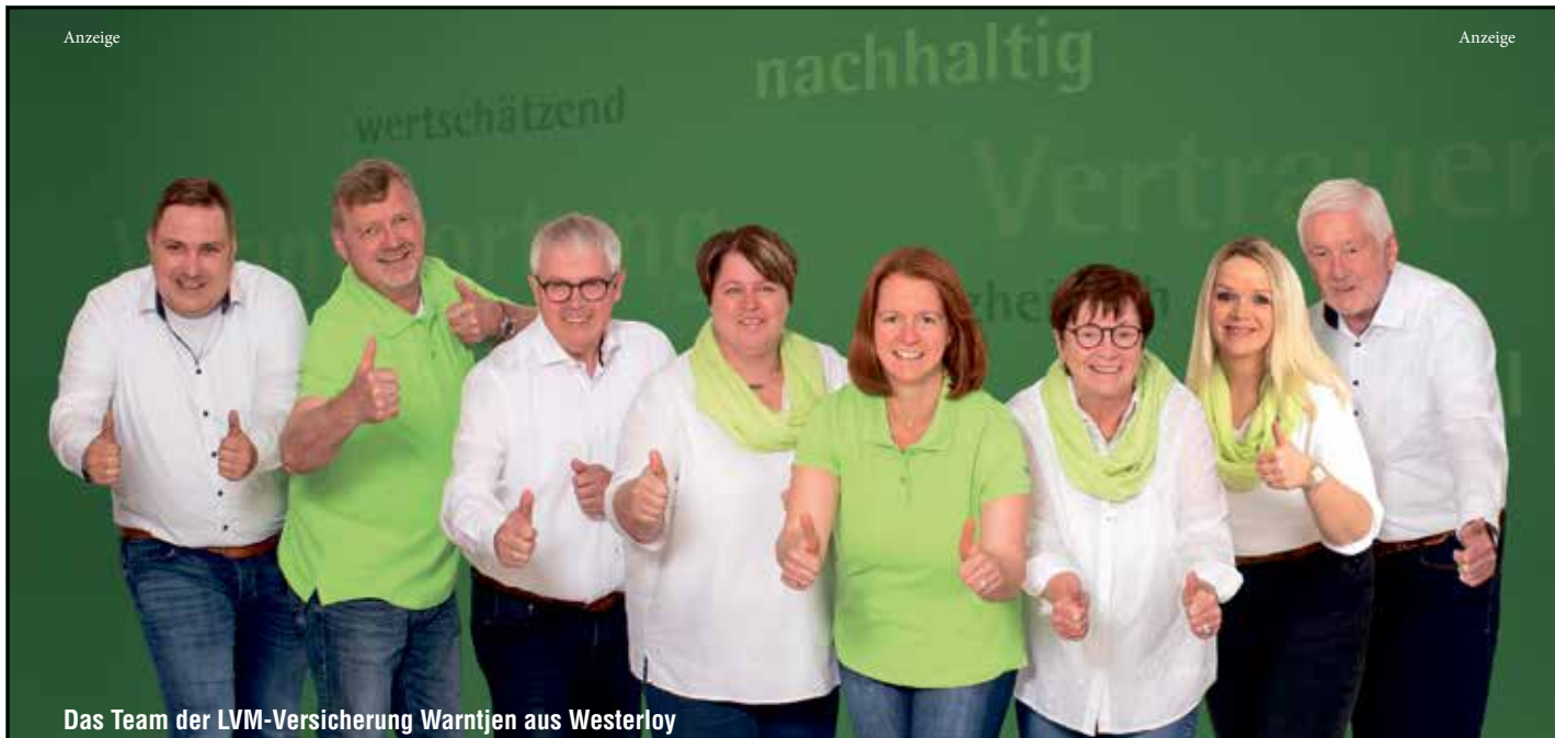
Das Team der LVM-Versicherung Warntjen aus Westerloy