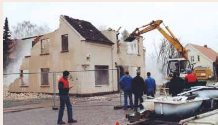
Am 13. März 2004 schaffte der Bagger Platz für das „Schulprojekt“.