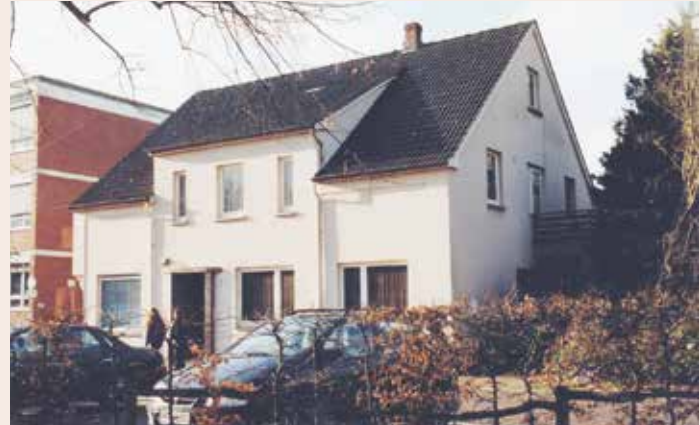
Seite an Seite mit dem Gymnasium. 2004

PS – Häuser erzählen ihre ganz eigenen Geschichten und haben Generationen oder gar Jahrhunderte überlebt. Somit spiegeln die alten Gebäude auch immer ein Stück Heimatgeschichte wieder. In dieser Rubrik werden geschichtsträchtige Häuser mit Vergangenheit vorgestellt, die nur noch zum Teil oder schon lange nur noch in unserer Erinnerung stehen.