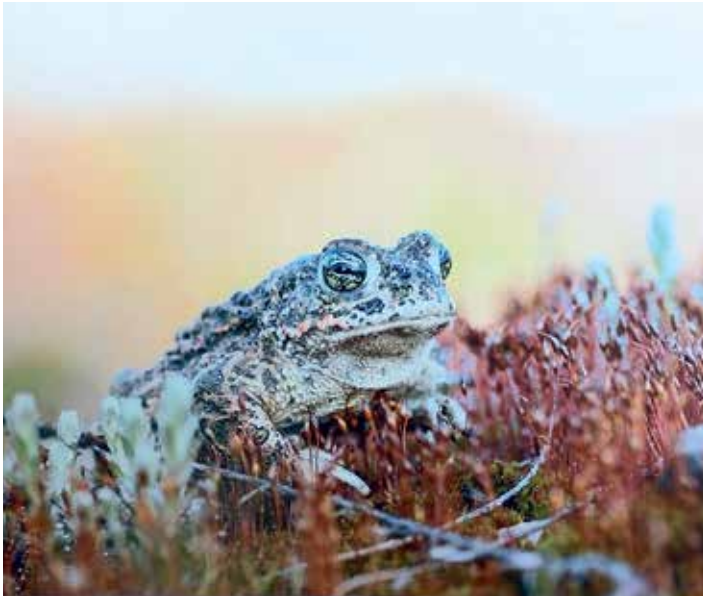
Siegerfoto 1. Platz