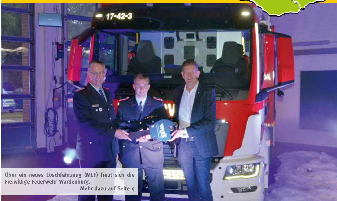
Über ein neues Löschfahrzeug (MLF) freut sich die Freiwillige Feuerwehr Wardenburg. Mehr dazu auf Seite 4