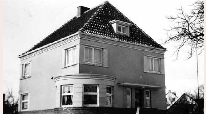
Undatierte Aufnahme, die ebenfalls Ende der 1930ern entstammen könnte.

PS – Häuser erzählen ihre ganz eigenen Geschichten und haben Generationen oder gar Jahrhunderte überlebt. Somit spiegeln die alten Gebäude auch immer ein Stück Heimatgeschichte wieder. In dieser Rubrik werden geschichtsträchtige Häuser mit Vergangenheit vorgestellt, die nur noch zum Teil oder schon lange nur noch in unserer Erinnerung stehen.