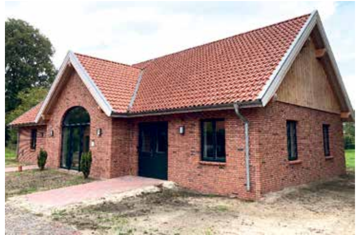
Das neue Gebäude steht jetzt zur Verfügung.