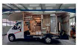
Unfallinstandsetzungen aller Art