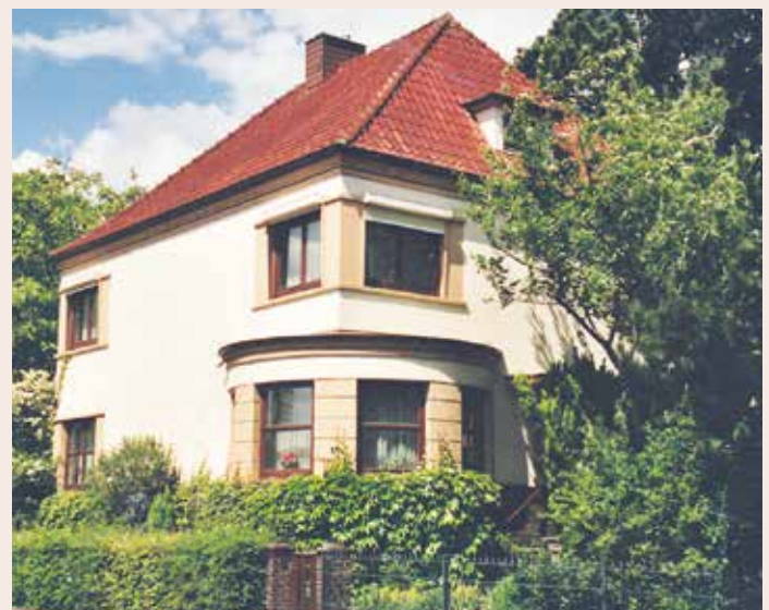
Das Stadthaus mit seinem schönen Garten, wie es noch 2005 ausgesehen hat.

Weil die Geschichte der Apothekervilla von Beginn an mit der Apotheke verknüpft war, sollte auch die Ära der einst ältesten Apotheke des Ammerlandes im Jahre 2006 enden. Zwar blieb das Gebäude erhalten, jedoch gehen dort seitdem keine Medikamente mehr über den Tresen sondern Backwaren. Wenngleich auch das mit Chemie zu tun hat, so wird hier aber wohl niemand mehr gestünder.