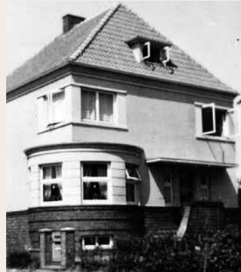
Nach Fertigstellung in den 1930er Jahren.