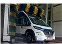
Waschanlage für Fahrzeuge bis 7,5t