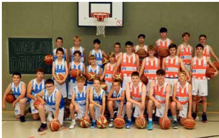
Die beiden Jugendmannschaften U14 und U16 der TSG Eagles freuen sich über ihre neuen Trikots und bedanken sich für die Spende.