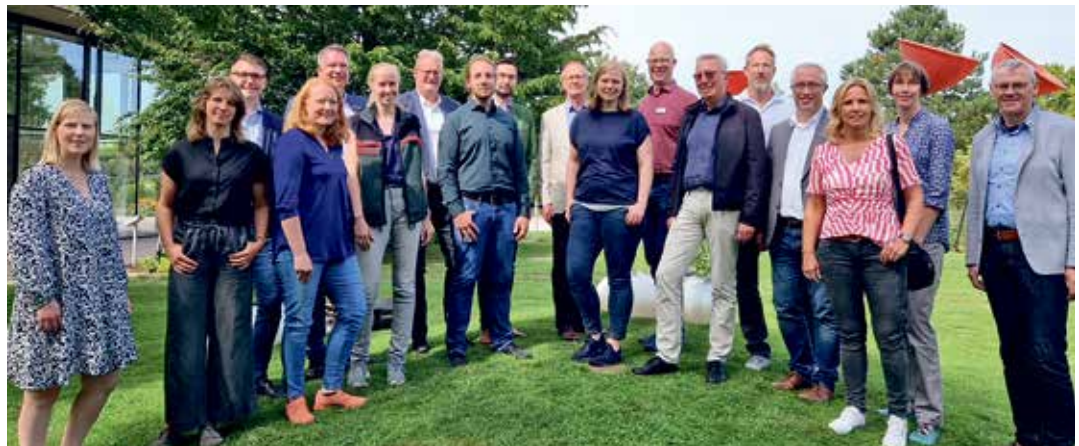
Die Steuerungsgruppe „Zukunftsregion4Klima“, bestehend aus Vertretern der Verwaltung und Zivilgesellschaft der vier Landkreise sowie ansässigen Wirtschafts- und Sozialpartnern, traf sich zur gemeinsamen Sitzung im Park der Gärten.

wk - Natur- und Kulturräume stärken und dabei Regionen nachhaltig fit für die Herausforderungen der Zukunft machen – das wollen die vier Landkreise Ammerland, Cloppenburg, Oldenburg und Vechta gemeinsam erreichen. Sie haben sich zur „Zukunftsregion4Klima“ zusammengetan, um regionsweite Projekte für mehr Nachhaltigkeit und Klimaschutz zu fördern. In ihrer jüngsten Sitzung kam die Steuerungsgruppe im Park der Gärten in Bad Zwischenahn zusammen, um die nächsten Schritte zu planen.