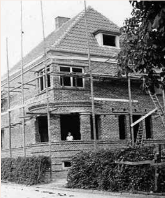
Die noch im Bau befindliche zukünftige „Apothekervilla“ im Jahre 1935.