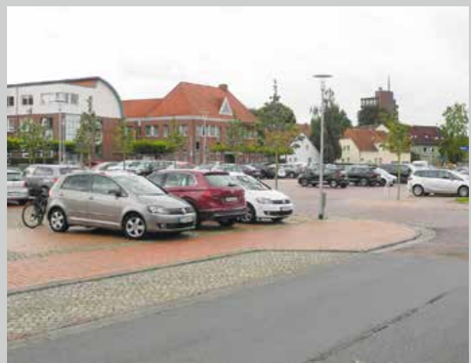
Wir danken dem Stadtarchiv Westerstede für die freundliche Unterstützung.

Ein Blick über den neuen Marktplatz, bevor er zum Albert-Post-Platz umgebaut und umbenannt wurde. Am linken Bildrand ist die Landessparkasse zu sehen, daneben der 1975 neu entstandene rückwärtige Anbau des damaligen Sanitärfachgeschäfts Feldmann. Die Aufnahme wurde um 1984 gemacht. Die Bankstraße verläuft heute (2023) an der Westersteder Tafel vorbei und gelangt in seiner Verlängerung auf die Straße „Am Rechter“.