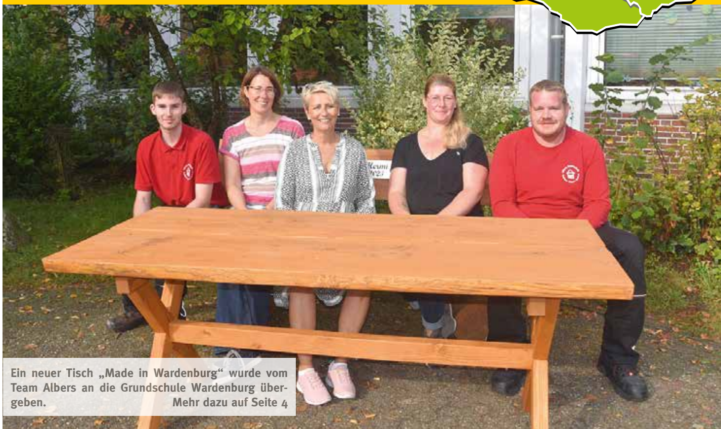
Ein neuer Tisch „Made in Wardenburg“ wurde vom Team Albers an die Grundschule Wardenburg übergeben. Mehr dazu auf Seite 4

Regionale Nachrichten // unabhängig/überparteilich