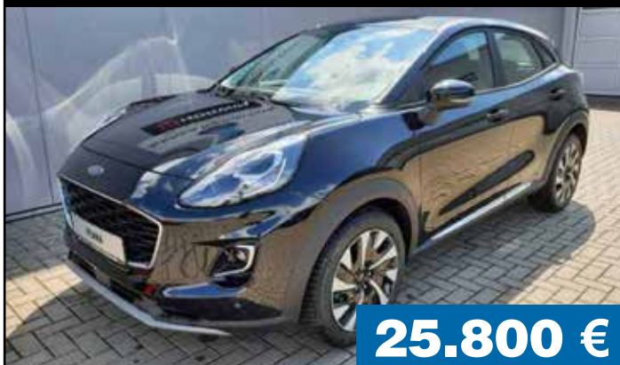
Ford Puma 1.0 EcoBoost Hybrid Titanium

Jahressteuer: 315 €, Kraftstoffkosten: 2458,26 €, Effizienzklasse: C, NEFZ-CO2 Emission (g/km): 165, NEFZ-Verbrauch kombiniert (l/kg/kWh /100 km): 6,3