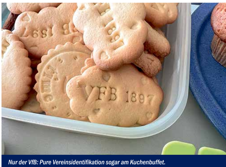
Nur der VfB: Pure Vereinsidentifikation sogar am Kuchenbuffet.