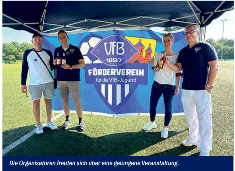
Die Organisatoren freuten sich über eine gelungene Veranstaltung.