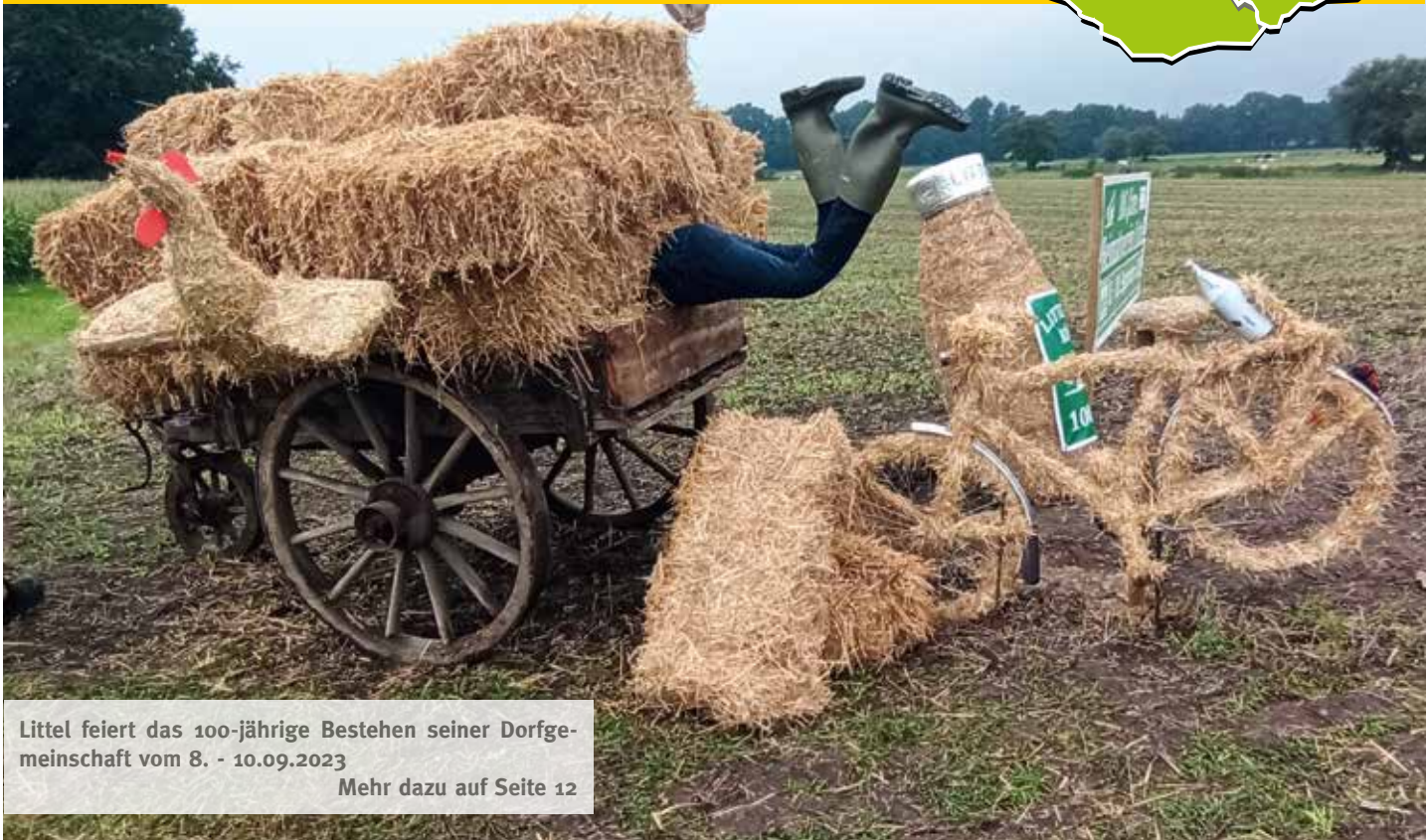
Littel feiert das 100-jährige Bestehen seiner Dorfgemeinschaft vom 8. - 10.09.2023 Mehr dazu auf Seite 12