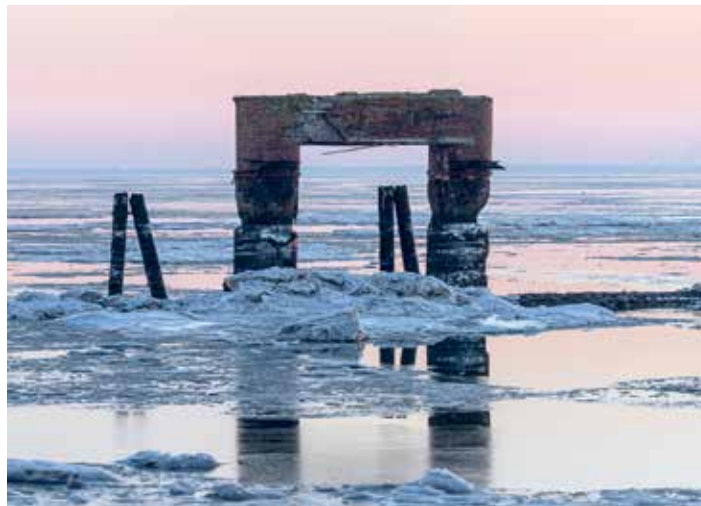
Ausstellung im Kreishaus.

wk - Im Kreishaus ist eine neue Fotoausstellung zu sehen: Der Fotograf Reiner Scheuch hat sich diesmal in seinen Arbeiten mit dem Thema „Unesco Weltnaturerbe – Wattenmeer“ auseinandergesetzt. Die beeindruckende Fotoausstellung beginnt am Dollart, der Grenzregion Deutschland/Niederlande, verläuft weiter an der Ostfriesischen Küste mit ihren Inseln, berührt den Jadebusen östlich von Wilhelmshaven, gelangt schließlich nach Butjadingen – der Halbinsel zwischen Weser und Jade, überquert bei Bremerhaven die Weser und endet in Schleswig-Holstein, dort in der Region der Halbinsel Eiderstedt, im Wattenmeer der Nordfriesischen Halligen und Inseln im Bereich der dänischen Grenze.