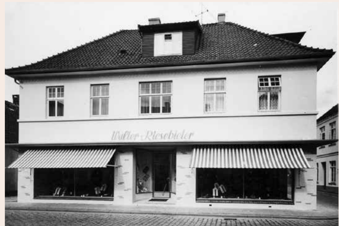
Das Herrenmodegeschäft von Riesebieter im Jahre 1965.