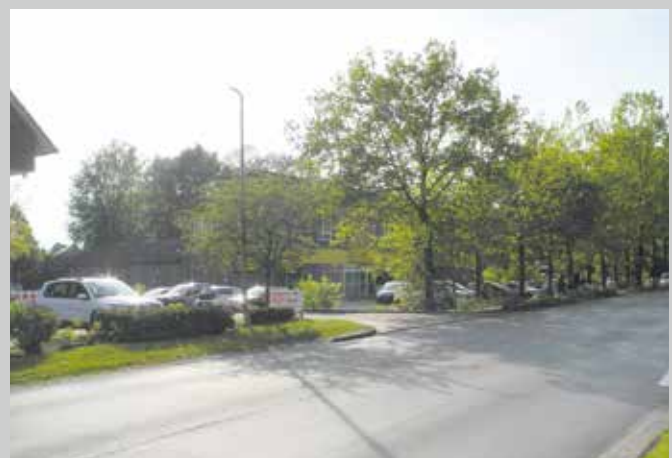
Wir danken dem Stadtarchiv Westerstede für die freundliche Unterstützung.

Obwohl diese Aufnahme noch nicht so sehr alt ist, zeigt sie doch einen Teil eines längst vergessenen Stadtbildes. Bis Ende der 1980er Jahre stand am Ende der Wilhelm-Geiler-Straße noch der „Kiosk Westerstede“. Davor war hier das Musikgeschäft Cording und das Jagd- und Bekleidungsgeschäft „Diana“ zu finden. Nach Abriss Anfang der 1990er Jahre entstand hier ein Verbrauchermarkt („Netto“). Die obere Etage wurde für ein Chinesisches Restaurant und Wohnungen genutzt.