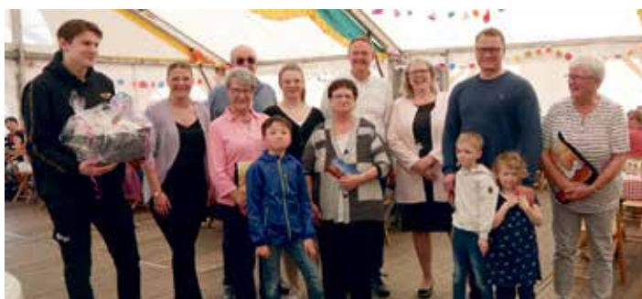
Die glücklichen Gewinner im Festzelt auf dem Frühjahrsmarkt Anfang Mai.