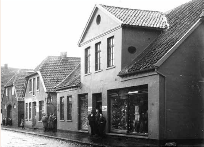
Noch mit einem Giebel zu Straßenseite, um 1900.

PS – Häuser erzählen ihre ganz eigenen Geschichten und haben Generationen oder gar Jahrhunderte überlebt. Somit spiegeln die alten Gebäude auch immer ein Stück Heimatgeschichte wieder. In dieser Rubrik werden geschichtsträchtige Häuser mit Vergangenheit vorgestellt, die nur noch zum Teil oder schon lange nur noch in unserer Erinnerung stehen.