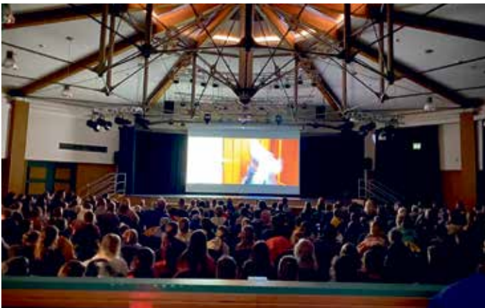
Volles Haus beim letzten Kinderkino