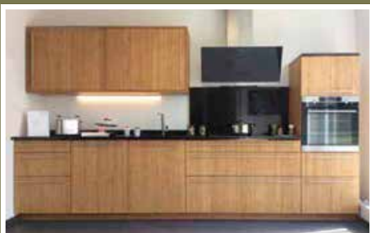
Zum zehnjährigen Jubiläum zeigt das Team ihr Meisterstück aus eigener Fertigung, das es so garantiert nicht zu kaufen gibt: eine Massivholzküche aus Bambus.