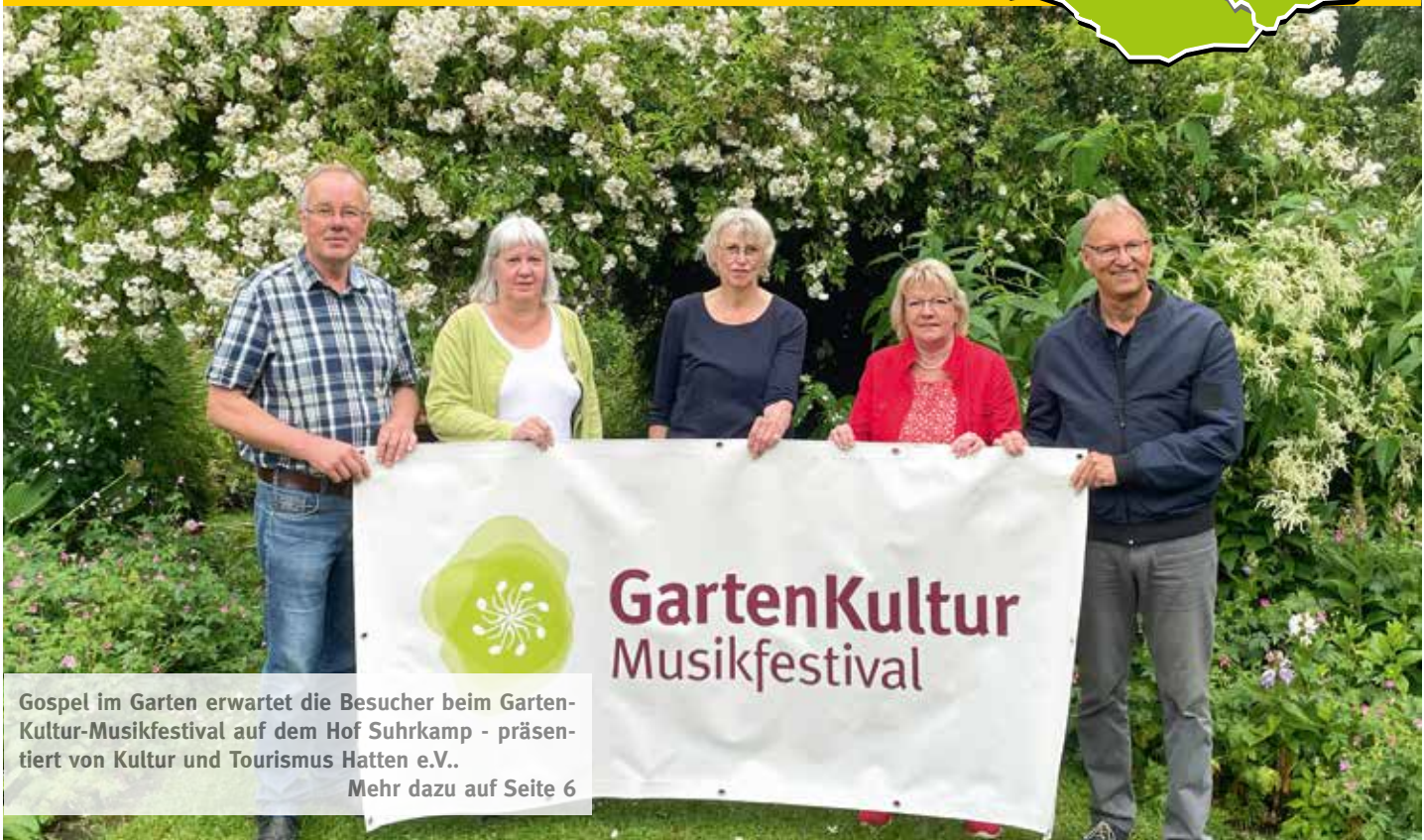
Gospel im Garten erwartet die Besucher beim GartenKultur-Musikfestival auf dem Hof Suhrkamp - präsentiert von Kultur und Tourismus Hatten e.V.. Mehr dazu auf Seite 6