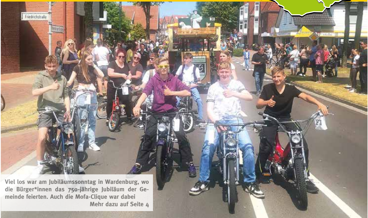
Viel los war am Jubiläumssonntag in Wardenburg, wo die Bürger*innen das 750-jährige Jubiläum der Gemeinde feierten. Auch die Mofa-Clique war dabei Mehr dazu auf Seite 4

Regionale Nachrichten // unabhängig/überparteilich