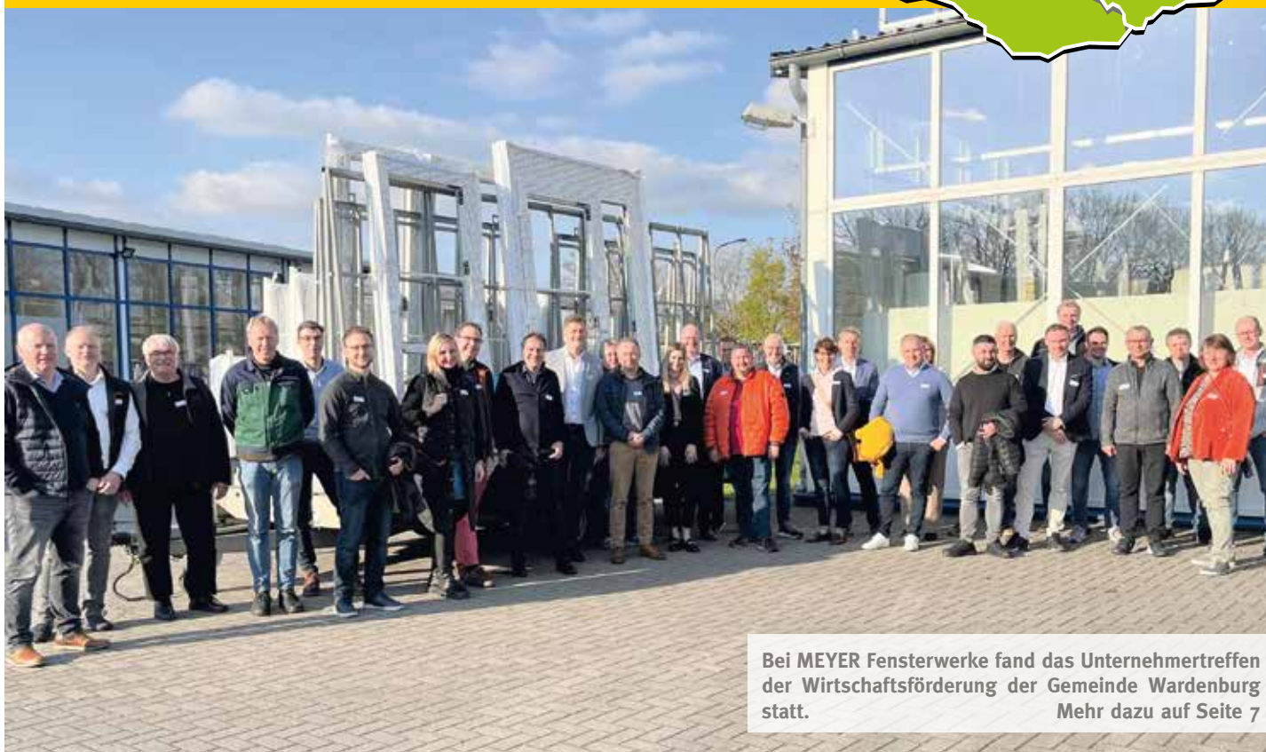
Bei MEYER Fensterwerke fand das Unternehmertreffen der Wirtschaftsförderung der Gemeinde Wardenburg statt. Mehr dazu auf Seite 7