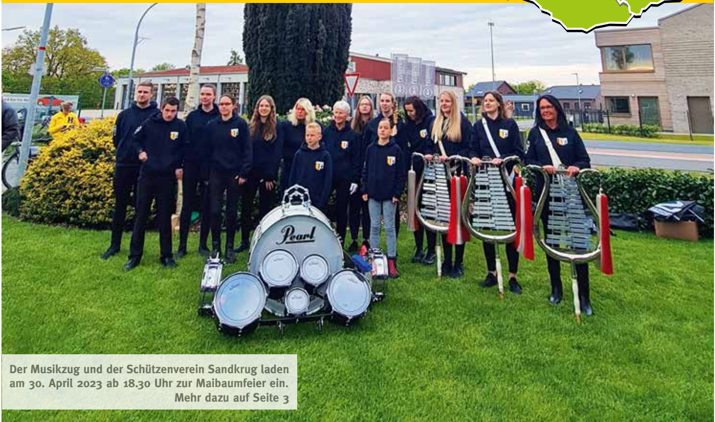
Der Musikzug und der Schützenverein Sandkrug laden am 30. April 2023 ab 18.30 Uhr zur Maibaumfeier ein. Mehr dazu auf Seite 3