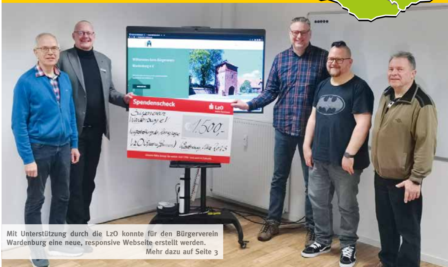
Mit Unterstützung durch die LzO konnte für den Bürgerverein Wardenburg eine neue, responsive Webseite erstellt werden. Mehr dazu auf Seite 3

Regionale Nachrichten // unabhängig/überparteilich