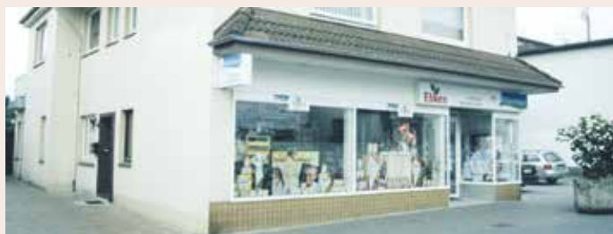
2002 wurde aus dem einstigen Küchenstudio ein Reformhaus. Aufnahme aus 2002.