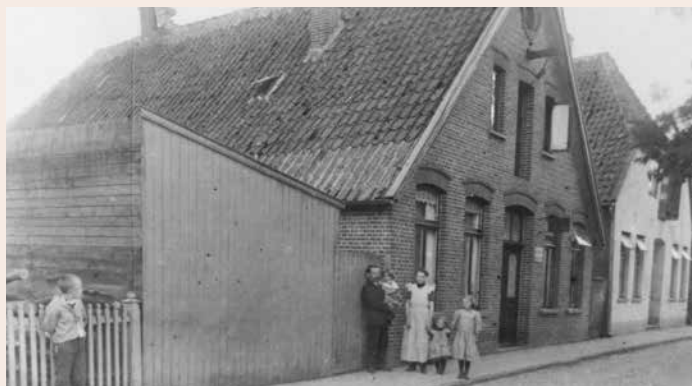
Damals Gaststraße 11, heute ist es die Hausnummer 3. Aufnahme um 1900.

PS – Häuser erzählen ihre ganz eigenen Geschichten und haben Generationen oder gar Jahrhunderte überlebt. Somit spiegeln die alten Gebäude auch immer ein Stück Heimatgeschichte wieder. In dieser Rubrik werden geschichtsträchtige Häuser mit Vergangenheit vorgestellt, die nur noch zum Teil oder schon lange nur noch in unserer Erinnerung stehen.