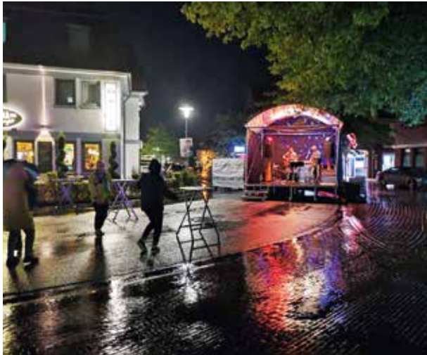
Die Besucher der KEN 2022 vor der Bühne „Am Pumpenhörn“, beim Ammerländer Hof, wurden zu „VIP-Gästen“ ernannt und konnten sich über ein Exklusivkonzert freuen...

(Bild & Text PS, Aufnahme 16. September 2022 - KEN)