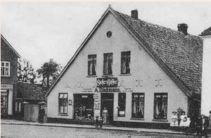
Die älteste bekannte Aufnahme des Hauses. Hier für eine Postkarte aufgenommen, um 1912.

PS – Häuser erzählen ihre ganz eigenen Geschichten und haben Generationen oder gar Jahrhunderte überlebt. Somit spiegeln die alten Gebäude auch immer ein Stück Heimatgeschichte wieder. In dieser Rubrik werden geschichtsträchtige Häuser mit Vergangenheit vorgestellt, die nur noch zum Teil oder schon lange nur noch in unserer Erinnerung stehen.