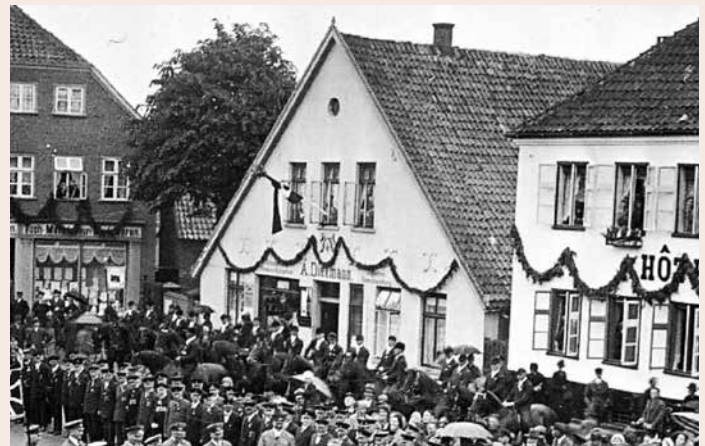
Immer Mitten im Geschehen. Auf dem Marktplatz direkt vor dem Haus ein Aufmarsch der Gruppe „Stahlhelm“ mit seinen Kriegsveteranen im Jahre 1931.