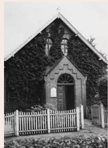
Eine etwas jüngeres Bild, das vermutlich noch vor 1950 aufgenommen wurde.

PS – Häuser erzählen ihre ganz eigenen Geschichten und haben Generationen oder gar Jahrhunderte überlebt. Somit spiegeln die alten Gebäude auch immer ein Stück Heimatgeschichte wieder. In dieser Rubrik werden geschichtsträchtige Häuser mit Vergangenheit vorgestellt, die nur noch zum Teil oder schon lange nur noch in unserer Erinnerung stehen.