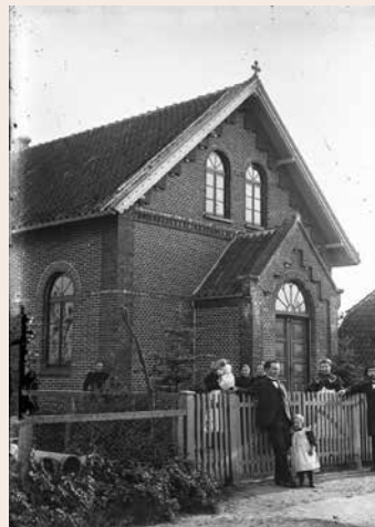
Auch diese Aufnahme entstand um 1900.