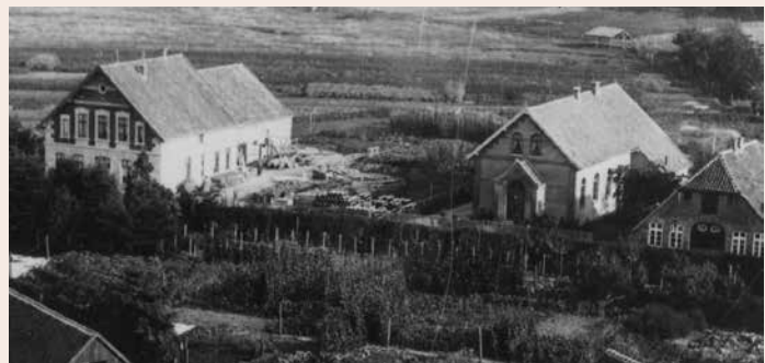
Diese sehr alte Aufnahme wurde noch vor 1900 gemacht. In der Mitte die Kapelle, rechts das Haus der Familie Siems und links der aufstrebende Baustoffhandel Ziese.

Die „neue“ Methodistenkirche jedoch ist bis heute (2022) noch in Norderstraße 4 zu finden.