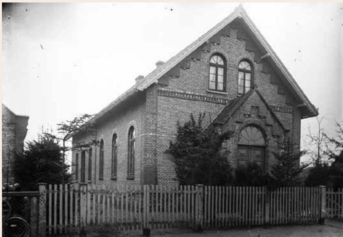
Die „neue“ Methodistenkirche von 1894 in der Gaststraße 9. Aufnahme um 1900.