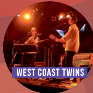
WEST COAST TWINS