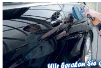
Wir beraten Sie gern.

Glänzende Aussichten für Ihren Wagen - dank unserer Lackaufbereitung.