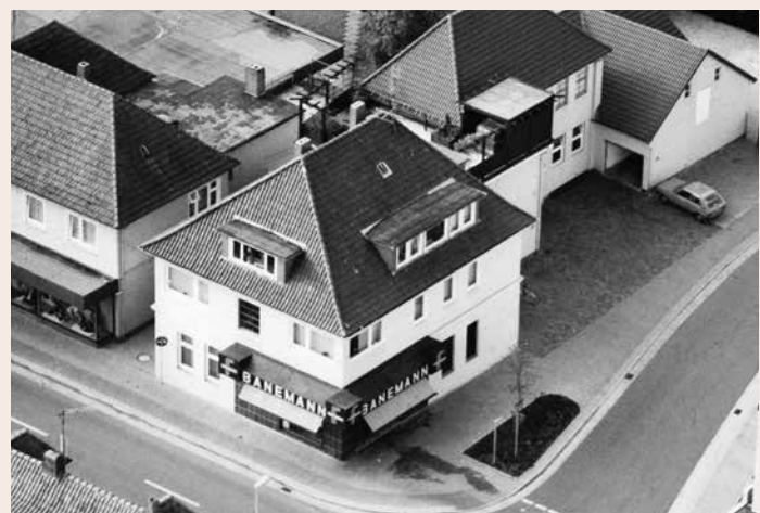
Die Luftaufnahme zeigt den ganzen Gebäudekomplex nach dem Umbau 1978. Der Ladeneingang jetzt zur Straße „An der Wiek“.

Der neue Eigentümer nutzte die Ladenfläche für das angrenzende Fahrradgeschäft „hen-co“, die dort zunächst einen Ausstellungsraum einrichteten. Seit 2013 befindet sich in dem ehemaligen Verkaufsladen des Fleischereifachgeschäfts eine Spielhalle.