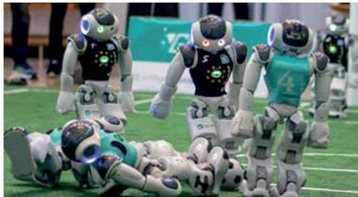
Starker Auftritt: Die Bremer Roboterfußballer vom B-Human-Team (schwarzes Trikot) blieben beim RoboCup 2022 in Hamburg nicht nur ungeschlagen, sondern auch ohne Gegentor. Lohn war der erneute Titelgewinn.

wk - Titelgewinn ohne ein einziges Gegentor: B-Human – das Roboterfußball-Team der Universität Bremen und des Deutschen Forschungszentrums für Künstliche Intelligenz (DFKI) – hat wieder einmal den RoboCup German Open gewonnen. Nach zweijähriger pandemiebedingter Pause wurden vom 12. bis 17. April in Hamburg beim German Open Replacement Event (GORE) – einem von fünf dezentral organisierten Events des RoboCups – Deutschlands beste Roboterkicker ermittelt.