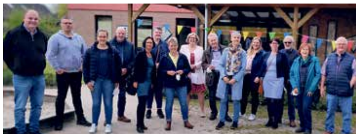
Die Teilnehmer der Kitabereisung vor dem Kindergarten „Am Schützenbusch“

PS - Am 03. Mai 2022 hat eine Bereisung der Kindertagesstätten stattgefunden. Alle Ratsmitglieder und hier insbesondere die Mitglieder des Sozialausschusses sowie Mitglieder des Stadtelternrates, Kitaträger, Einrichtungsleitungen und Vertreter der Kitaverwaltung haben die Gelegenheit genutzt, um sich vor Ort einen Einblick in die Arbeit und Betreuungssituation sowie den damit verbundenen aktuellen Problemen zu verschaffen. Die Frage, wie eine individuelle Förderung der Kinder unter dem Aspekt mangelnder Fachkräfte, veränderter gesellschaftlicher Werte und Bedarfe gelingen kann, bewegte dabei alle Einrichtungen gleichermaßen. Für die kommenden Jahre wurde die Aufrechterhaltung und Verbesserung der Qualität der Kinderbetreuung und die Mitarbeiterzufriedenheit als oberstes Ziel gesehen. Das dies nur gelingen kann, wenn alle Beteiligten an einem Strang ziehen, wurde bei der ganztägigen Bereisung sehr schnell deutlich. Der nächste Sozialausschuss wird sich nun unter anderem mit den gewonnenen Erkenntnissen aus der Kitabereisung befassen und erste Lösungsansätze diskutieren.