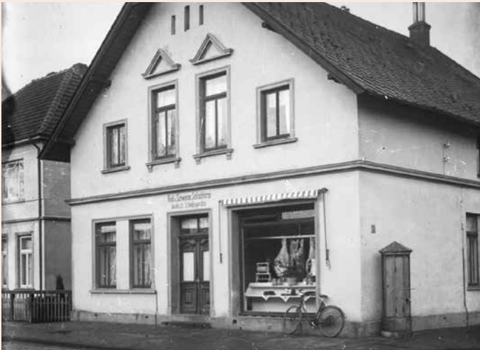
Das Stadthaus wurde durch Dietrich Scholjegerdes erstmalig zum Fleischereigeschäft. Aufnahme um 1927.

PS – Häuser erzählen ihre ganz eigenen Geschichten und haben Generationen oder gar Jahrhunderte überlebt. Somit spiegeln die alten Gebäude auch immer ein Stück Heimatgeschichte wieder. In dieser Rubrik werden geschichtsträchtige Häuser mit Vergangenheit vorgestellt, die nur noch zum Teil oder schon lange nur noch in unserer Erinnerung stehen.