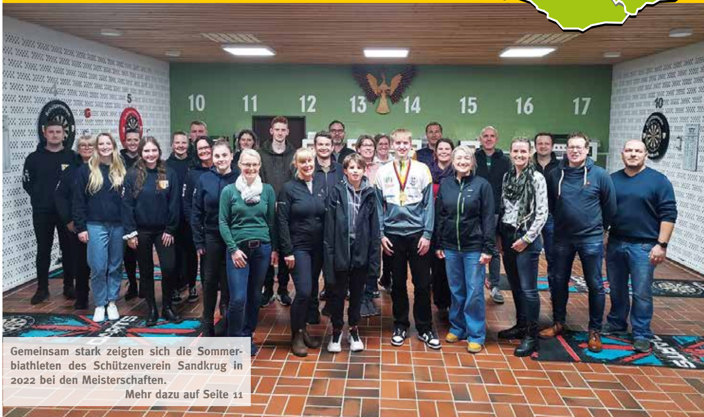
Gemeinsam stark zeigten sich die Sommerbiathleten des Schützenverein Sandkrug in 2022 bei den Meisterschaften.