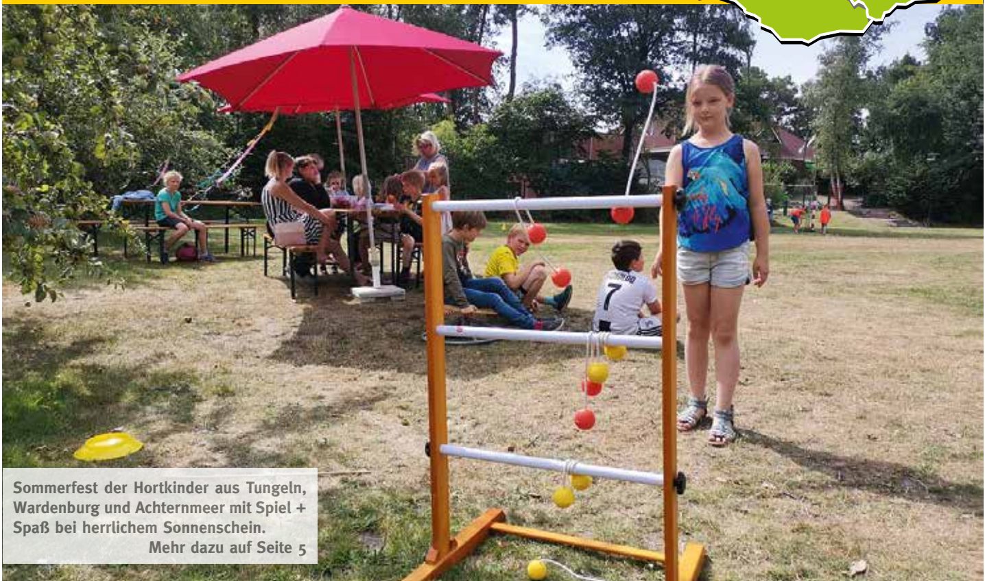
Sommerfest der Hortkinder aus Tungeln, Wardenburg und Achternmeer mit Spiel + Spaß bei herrlichem Sonnenschein. Mehr dazu auf Seite 5