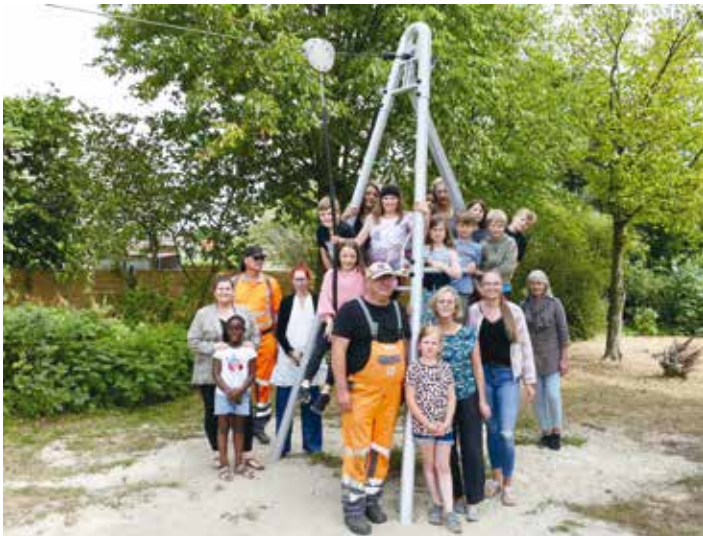
Die Kinder des Hortes Wardenburg mit ihren Betreuerinnen und Mitarbeitern des Baubetriebshofes sowie der Gemeindeverwaltung.

Der von Kindern viel genutzte Spielplatz in der Hermann-Allmers-Straße in Wardenburg hat eine neue Seilbahn erhalten. Am ersten Ferientag machten die Kinder aus dem Hort Wardenburg einen kleinen Ausflug zum Spielplatz, um das neue Spielgerät gebührend einzuweihen. Die alte Seilbahn aus dem Jahre 2008 musste dringend ersetzt werden. Die Konstruktion aus Lärchenholz hatte witterungsbedingt stark gelitten und mit Reparaturen allein war kein