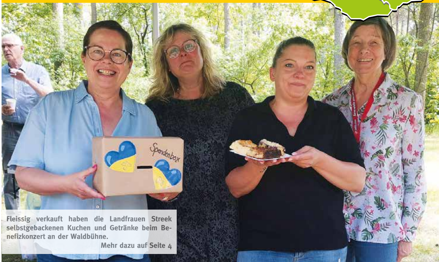
Fleissig verkauft haben die Landfrauen Streek selbstgebackenen Kuchen und Getränke beim Benefizkonzert an der Waldbühne.