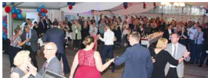
Ball mit über 400 Gästen wurde vom Festausschuss eröffnet