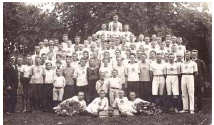
Vor 100 Jahren waren die Mitglieder schon gerne für ein Foto bereit.

Der Bardenflether Turnerbund wird in diesem Jahr 125 Jahre alt. Das muss gefeiert werden! In Planung ist eine Jubiläumsparty für das ganze Dorf mit Tanz und Musik. Bis jetzt hat jede Jubiläumsfeier im Eckflether Kröog stattgefunden. Das ist zum 125-jährigen Jubiläum nicht möglich, da es dort zu wenig Platz gibt. Daher findet am 16.