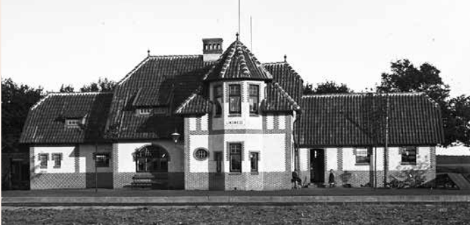
Die rückwärtige Ansicht des Bahnhofs, um 1910.

PS – Häuser erzählen ihre ganz eigenen Geschichten und haben Generationen oder gar Jahrhunderte überlebt. Somit spiegeln die alten Gebäude auch immer ein Stück Heimatgeschichte wieder. In dieser Rubrik werden geschichtsträchtige Häuser mit Vergangenheit vorgestellt, die nur noch zum Teil oder schon lange nur noch in unserer Erinnerung stehen.