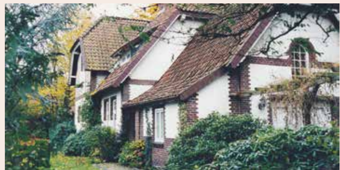
Zwar seiner Bestimmung enthoben, aber wieder zu neuem Leben erweckt! Bild 1994.