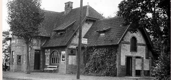
In den 1950ern etwas in die Jahre gekommen, aber noch in Betrieb.

Der Siegeszug der Bahn war nicht aufzuhalten, doch es sollten fast 30 Jahre vergehen bis auf der Verbindungsstrecke die Schmalspurbahnen „Mansingen“ und „Burgforde“ ihren Dienst einstellen konnten. 1904 wurde auf Normalspur umgestellt und jetzt verkehrte eine ausgewachsene Dampflok auf diesen Gleisen. Dem Umstand, dass der Kaiser Wilhelmshaven zu seinem Kriegsmarinehafen ausbauen ließ, war es zu verdanken, dass die Strecke von Westerstede über Linswege, Eggeloge bis nach Ellenserdamm weitergeführt wurde. Die Haltestelle Linswege erhielt sogar noch vor Westerstede seinen eigenen Bahnhof. Am 1. Oktober 1905 wurde der Bahnhof festlich geschmückt, Linswege beflaggt und die Einweihung im ganzen Dorf groß gefeiert. Bereits nach dem I. Weltkrieg gewann das Automobil immer mehr an Bedeutung in der Folgezeit entbrannte ein wahrer Wettstreit zwischen Schiene und Straße. Im II. Weltkrieg wurde die Bahnstrecke nach