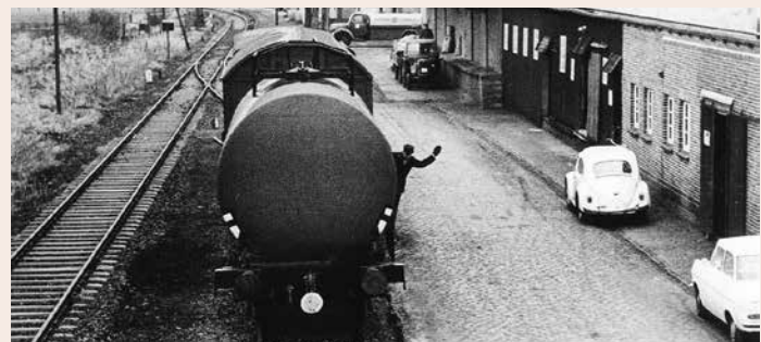
Reges Treiben vor dem Tanklager am Bahnhof. Um 1960.

Lagerhallen wurden sukzessive bis 2005 abgerissen. Mit der fehlenden Daseinsberechtigung geriet auch das Bahnhofsgebäude über die Jahre in Vergessenheit. Anfang der 1980er Jahre wurde er an Privat weiterverkauft. Damit wurde der Bahnhof vor dem Verfall gerettet. Dem neuen Eigentümer war es zu verdanken, dass der Bahnhof in seiner Ursprünglichkeit und ganzen Pracht als denkmalgeschütztes Gebäude dem Dorf erhalten blieb. Es wird bis heute (2023) als Wohnhaus genutzt. Auch wenn sich manch einer wieder eine Schienenanbindung zurückwünschen würde, so ist dieser Zug wohl für immer abgefahren.