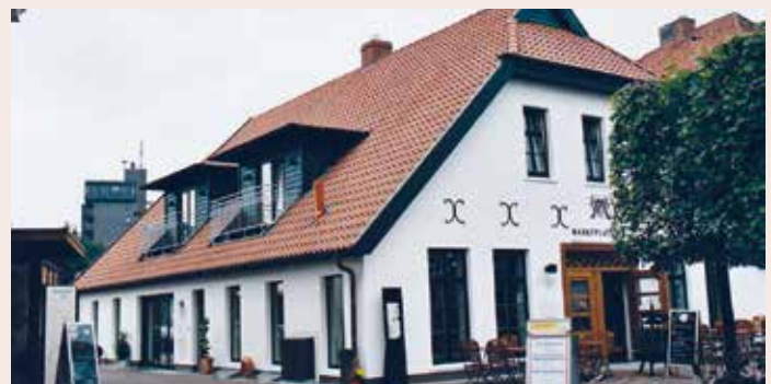
Im alten Stil 2005 wieder auferstanden. Im Inneren das Restaurant „Feingefühl“ mit Weinverkauf. Links das Café „Schneider's“.

An der Giebelseite des schönen Neubaus von 2005 erinnert noch heute eine Stuckarbeit an die früheren Eigentümer. Zwei aufbäumende Pferde stehen für den Pferdehändler, der dieses Haus einst erbaute und die Initialen A.D. für die folgende Kaufmannsfamilie Diekmann.