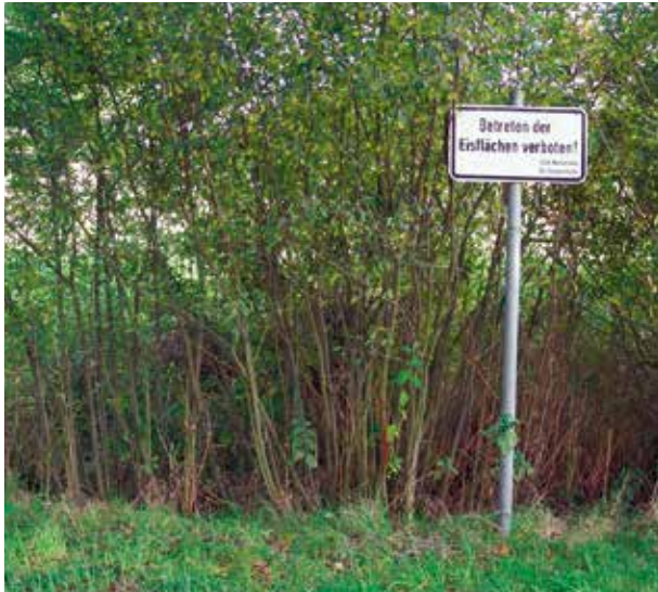
Archäologen und Klimaforscher sind sich jetzt sicher: Das Schild „Betreten der Eisflächen verboten“ stammt aus einem anderen Jahrtausend!