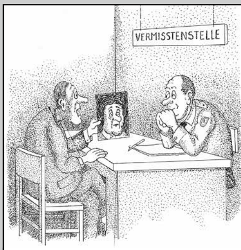
Hier ein Bild meiner Frau. Und...es eilt nicht! (Zeichnung: Peter Kaste – Text: Stefan Stark)