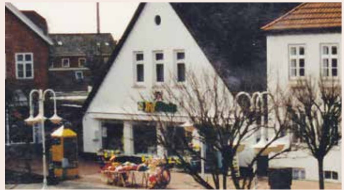
Auch im Jahre 1995 noch „Ihr Platz“. Nach Fertigstellung der „Meinardusstraße“ zog der Markt um.

PS – Häuser erzählen ihre ganz eigenen Geschichten und haben Generationen oder gar Jahrhunderte überlebt. Somit spiegeln die alten Gebäude auch immer ein Stück Heimatgeschichte wieder. In dieser Rubrik werden geschichtsträchtige Häuser mit Vergangenheit vorgestellt, die nur noch zum Teil oder schon lange nur noch in unserer Erinnerung stehen.