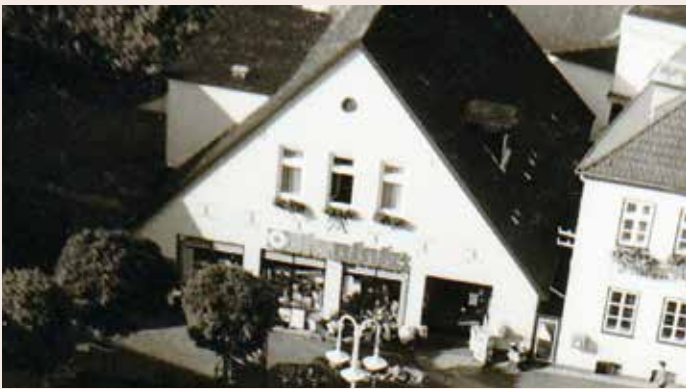
Aus „Seifen Puls“ wurde „Ihr Platz“ und prägte lange Zeit das Gesicht des Gebäudes. Bild Anfang der 1980er.